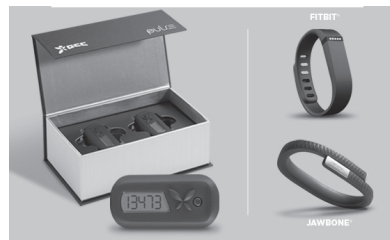
Илустрација 5: GCC Pulse

Програм GCC користи адекватну опрему и софтвер, који омогућавају праћење, контролу и мерење резултата који се постижу програмом, и пружају основу за функционисање самог програма. Приликом имплементирања програма у организацији, запослени добијају педометар (илустрација 5). GCC Pulse Accelerometer , који им омогућава да мере број пређених корака у току сваког дана, а поред тога, уређај прати укупну активност путем савременог 3D сензора (пређени пут, откуцаје срца, израчунавање броја утрошених калорија). Поред овог педометра, учесници могу користити и сопствене уређаје које већ поседују, а за њих постоји могућност да се повежу са GCC сајтом (Garmin, Fitbit, Misfit, Jawbone).