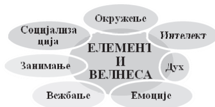
Илустрација 1: Елементи велнеса

Wellness ( well-being – бити добро, добро се осећати; fit-ness – бити у форми, бити у кондицији), велнес значи осећати се добро, при чему то не значи само бити здрав, него бити срећан и здрав. То је хармонично здравствено стање тела и духа које се темељи на самоодговорности човека и његовом односу према природи и околини. 6 Илустрацијом 1 представљени су елементи велнеса.