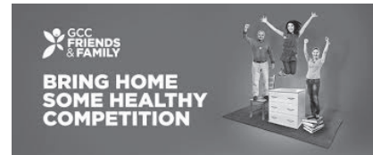
Илустрација 9: Лого GCC friends & family

Правила програма, софтвера и опрема, циљеви и реализација програма и подршке се одвијају на идентичан начин као код корпоративног програма.